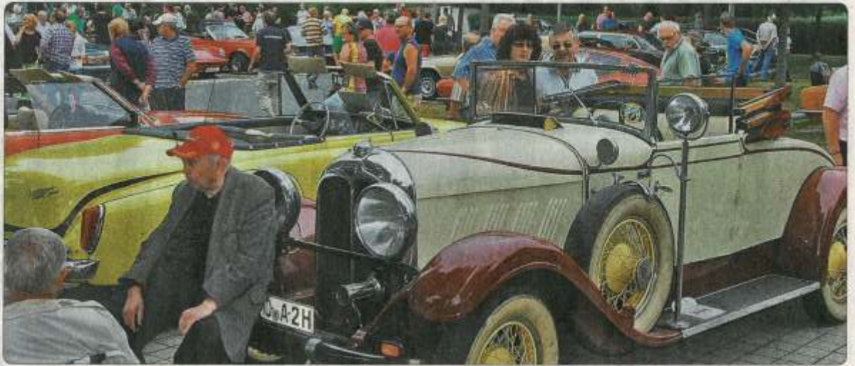
Volles Haus beim Spielbank-Classic-Treffen. Hier reihte sich ein Schmuckstück ans nächste.

Die Palette reichte von einigen Vorkriegs-Oldtimern und ganz normalen (Youngtimer-)Alltagsautos der siebziger und achtziger Jahre über die unterschiedlichsten Coupés und Cabriolets bis hin zu respektablen Sport- und gar Renn- und Rallyewagen. Aber auch Motorräder und Gespanne waren dem Ruf des Automobilclubs (AC) Hof und des