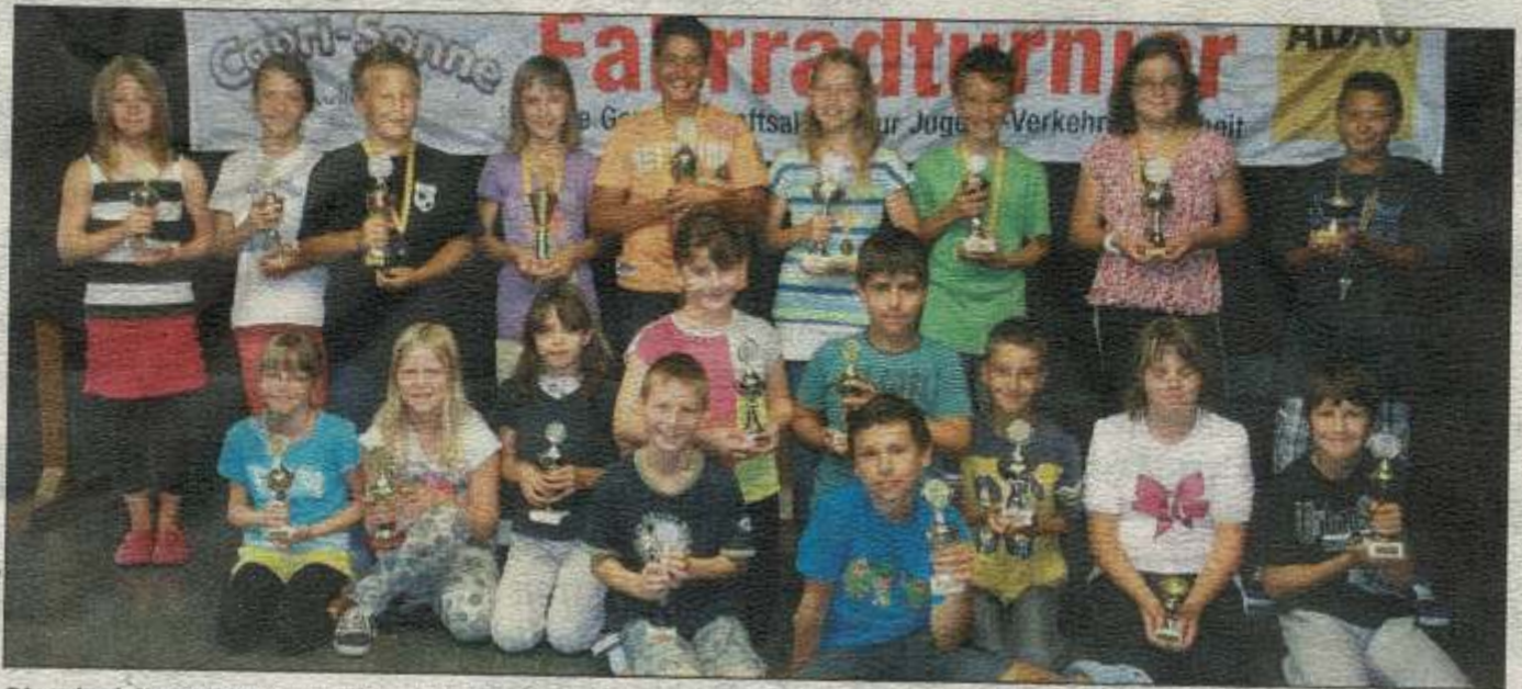
Sie sind fit auf dem Drahtesel, die Grundschüler aus Naila.