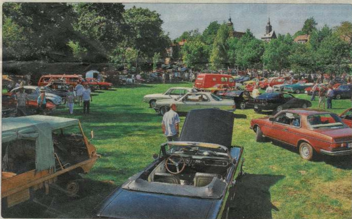
Old- und Youngtimer so weit das Auge reicht gibt es am kommenden Sonntag vor der Spielbank Bad Steben zu sehen.

mer kämpft und die besten und schönsten Autos und Motorräder prämiert. Diese werden am späten Nachmittag mit kleinen Präsenten ausgezeichnet, woraufhin sich das Classic-Treffen seinem Ende entgegen neigt und die zum Teil weit gereisten Teilnehmer die Heimreise antreten. Weitere Informationen gibt es im Internet unter www.ac-hof.de oder www.oc-naila.de . Gerd Plietsch