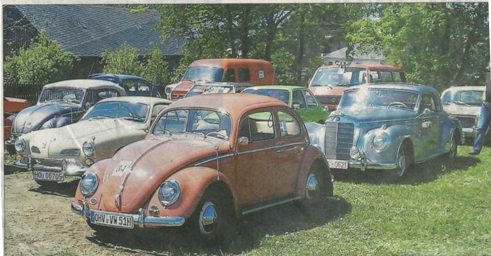
Parkplatz der Superlative: vom gemeinen VW-Käfer bis hin zum exklusiven Mercedes 300 war bei der Tour de Franken 2012 fast alles dabei.

Oldtimer-Fahrer genießen die „Tour de Franken“.